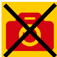
Bild-, Film- und Tonaufnahmen sind auf dem gesamten Betriebsgelände untersagt .

Bitte beachten Sie, dass unsere Security Sie vor dem Betreten des Luftsicherheitsbereichs kontrolliert.